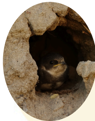
Hirondelle de rivage