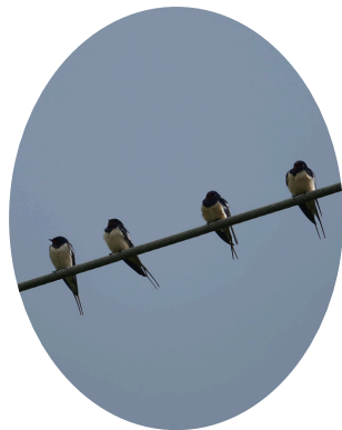
Hirondelles rustiques

Connectez-vous, depuis votre smartphone ou votre ordinateur, à l'application iNaturalist. Si l'occasion se présente et que vous pouvez photographier ou filmer l'animal — sans utiliser de flash — c'est une excellente opportunité. Vous pouvez également enregistrer leurs chants ! N'hésitez pas à déposer ensuite votre observation sur la plateforme. Si vous utilisez votre téléphone avec l'application, vos données seront directement intégrées à l'Atlas de la Biodiversité de votre commune.